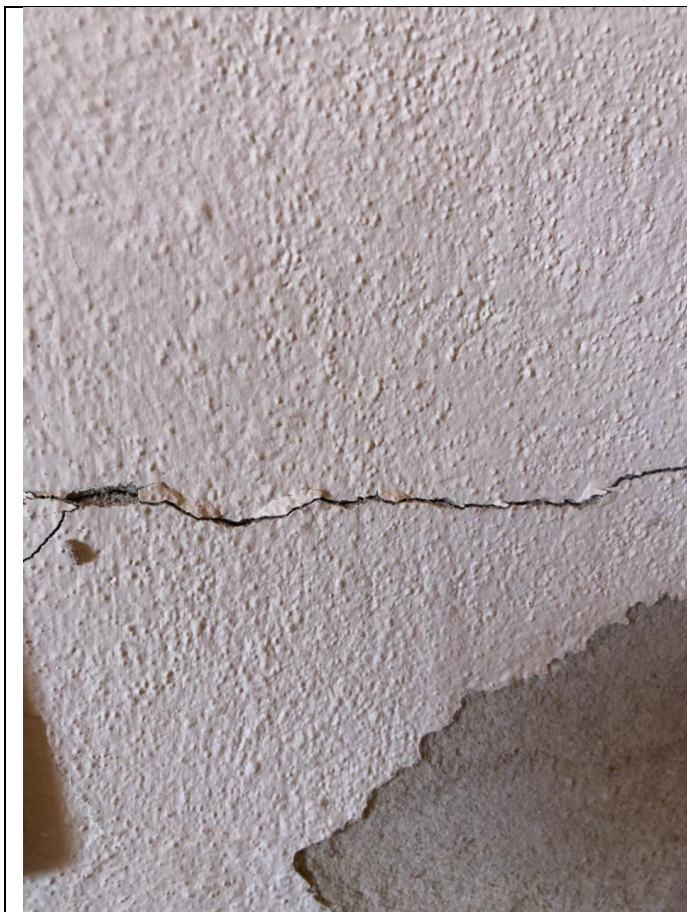
Foto 3. Rachadura na estrutura da casa