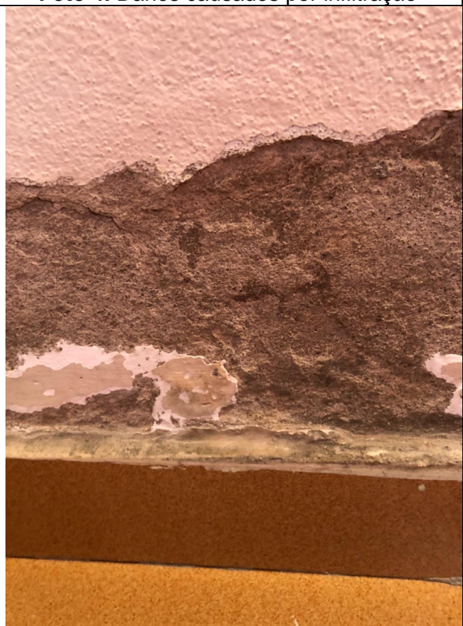
Foto 6. Danos causados por infiltração