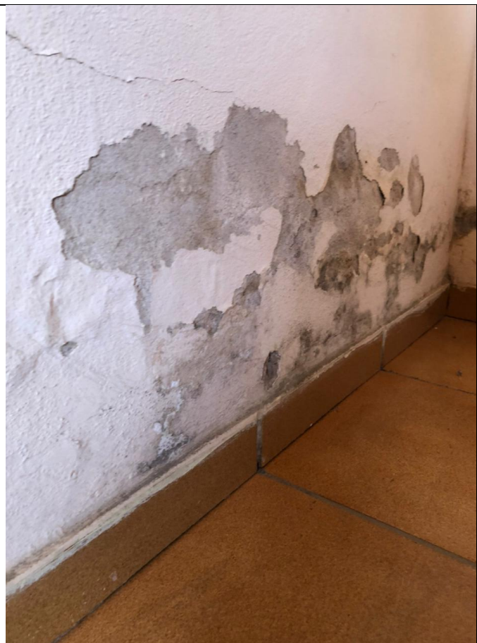
Foto 4. Danos causados por infiltração