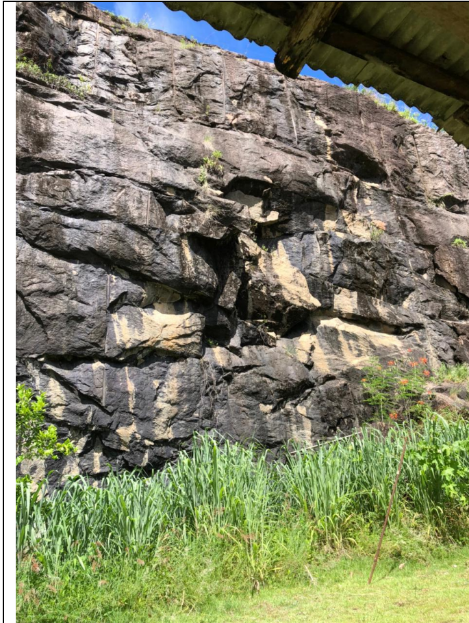
Foto 1. Talude Rochoso