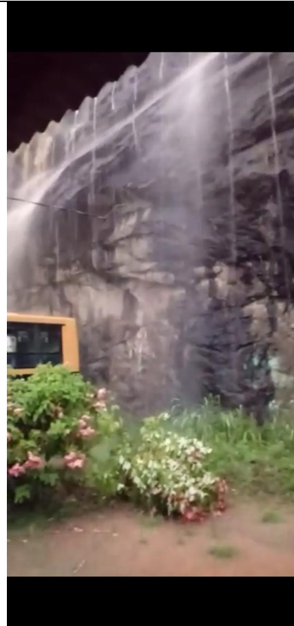
Foto 2. Escoamento de Águas Pluviais